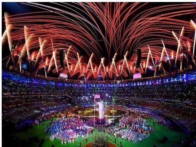
Imagem alusiva à abertura dos jogos de 2012

É a partir da bandeira que se dá o início dos jogos olímpicos, foi produzida pela casa da moeda com a tiragem de dois milhões, para o encerramento dos jogos de Londres de 2012. Porém os colecionadores brasileiros subentendeu que a moeda da bandeira fazia parte da coleção das 16 moedas das olimpíadas e paraolimpíadas de 2016.