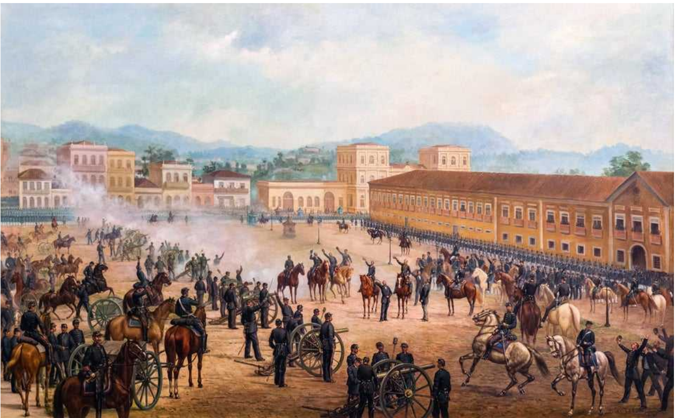
Proclamação da República, óleo sobre tela de Benedito Calixto, 123,5x200 cm. Pinacoteca do Estado de São Paulo