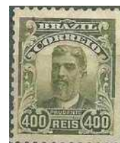
RHM 142 Prudente de Moraes

No final do mandato Prudente de Moraes retirou-se para Piracicaba, voltando a exercer a advocacia, até sua morte em dezembro de 1902 por tuberculose.