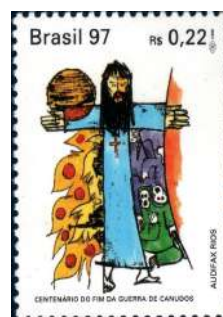
RHM C-2045 - Centenário do fim da Guerra dos Canudos

O arraial resistiu até 5 de outubro de 1897, quando morreram os quatro derradeiros defensores. Antônio Conselheiro havia morrido pouco antes, provavelmente de disenteria. O conflito de Canudos mobilizou aproximadamente doze mil soldados oriundos de dezessete estados brasileiros, distribuídos em quatro expedições militares. Em 1897, na quarta incursão, os militares incendiaram o arraial, mataram grande parte da população e degolaram centenas de prisioneiros. Estima-se que morreram ao todo por volta de 25 mil pessoas, culminando com a destruição total da povoação.