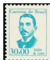
RHM 520 - Euclides da Cunha

Jornalista a convite do jornal "O Estado de São Paulo" que fez a cobertura da Guerra no Arraial de Canudos. O relato jornalístico foi publicado no livro "Os Sertões".