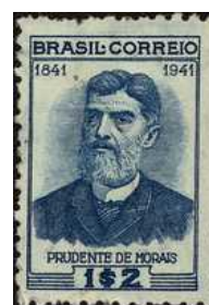
C-174 - Centenário de Nascimento de Prudente de Moraes