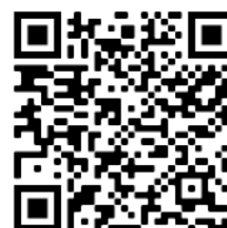
QRCode direcionando para o livro "Os Sertões" em arquivo pdf.

Jornalista a convite do jornal "O Estado de São Paulo" que fez a cobertura da Guerra no Arraial de Canudos. O relato jornalístico foi publicado no livro "Os Sertões".