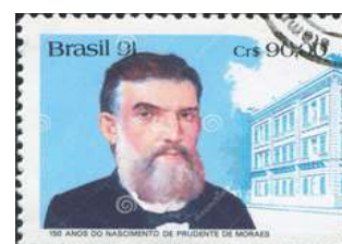
RHM C-1764 - 150 anos de Nascimento de Prudente de Moraes