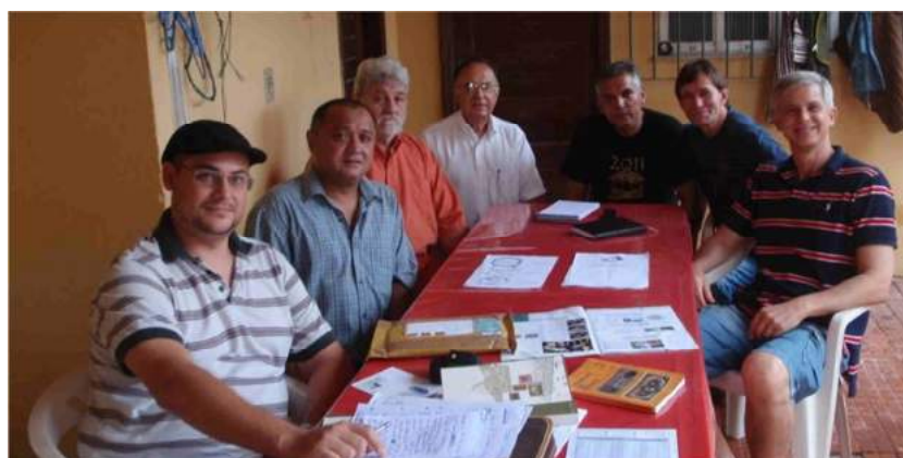
Foto histórica de 2011, primeira reunião na minha casa que culminou com a reativação da SOPHIPA.