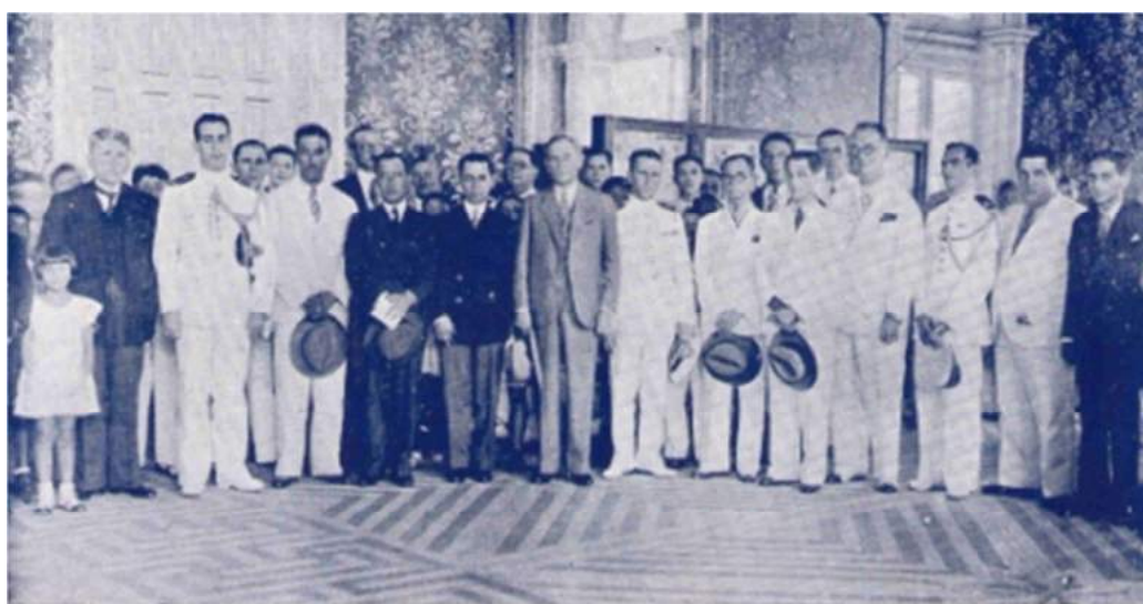
Foto da primeira Exposição Filatélica e Numismática em Belém-PA

Fundador e primeiro Presidente da SOPHIPA