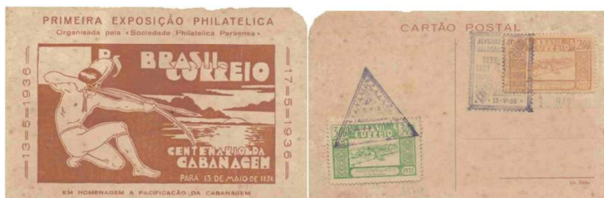
Cartão Postal da Exposição alusivo ao Centenário da Cabanagem

Este Cartão Postal faz parte da minha coleção, com carimbo comemorativo da exposição de 13/05/1936, e com selos (C-103 e C-104) de 26/02/1936 comemorativos ao Tricentenário da cidade de Cameté-PA.