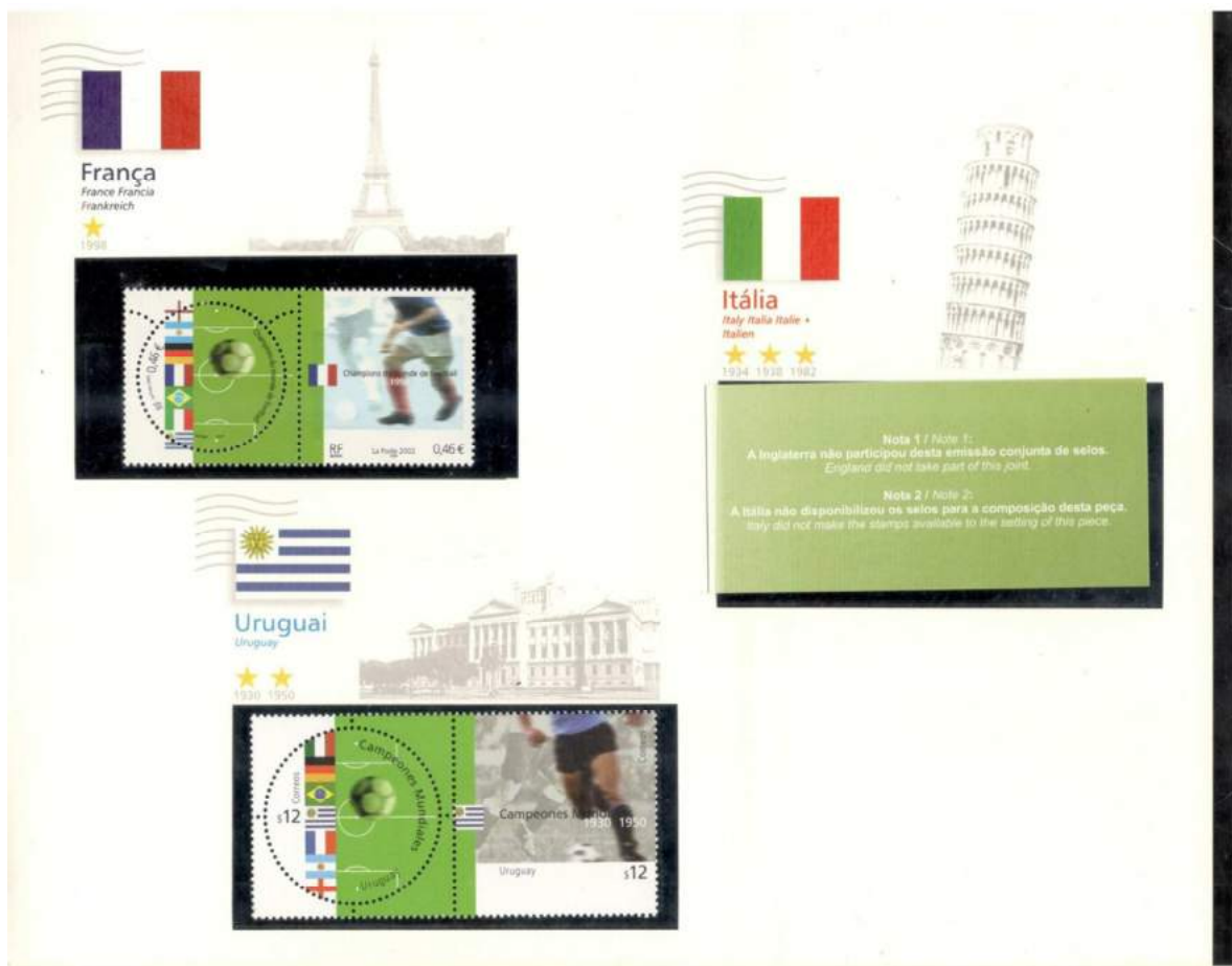
Imagem do selo da Itália que não foi vendido junto com a pasta.